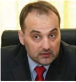
Заштитник грађана Саша Јанковић