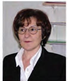
Заменица Покрајинског Омбудсмана Даница Тодоров